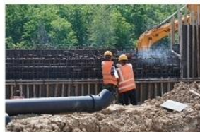
广茂路道路工程西起水南大街,东至智源街,道路全长约2.5公里,规划宽30米。目前,项目已完成路基工程及道路附属工程,预计6月底前竣工通车。