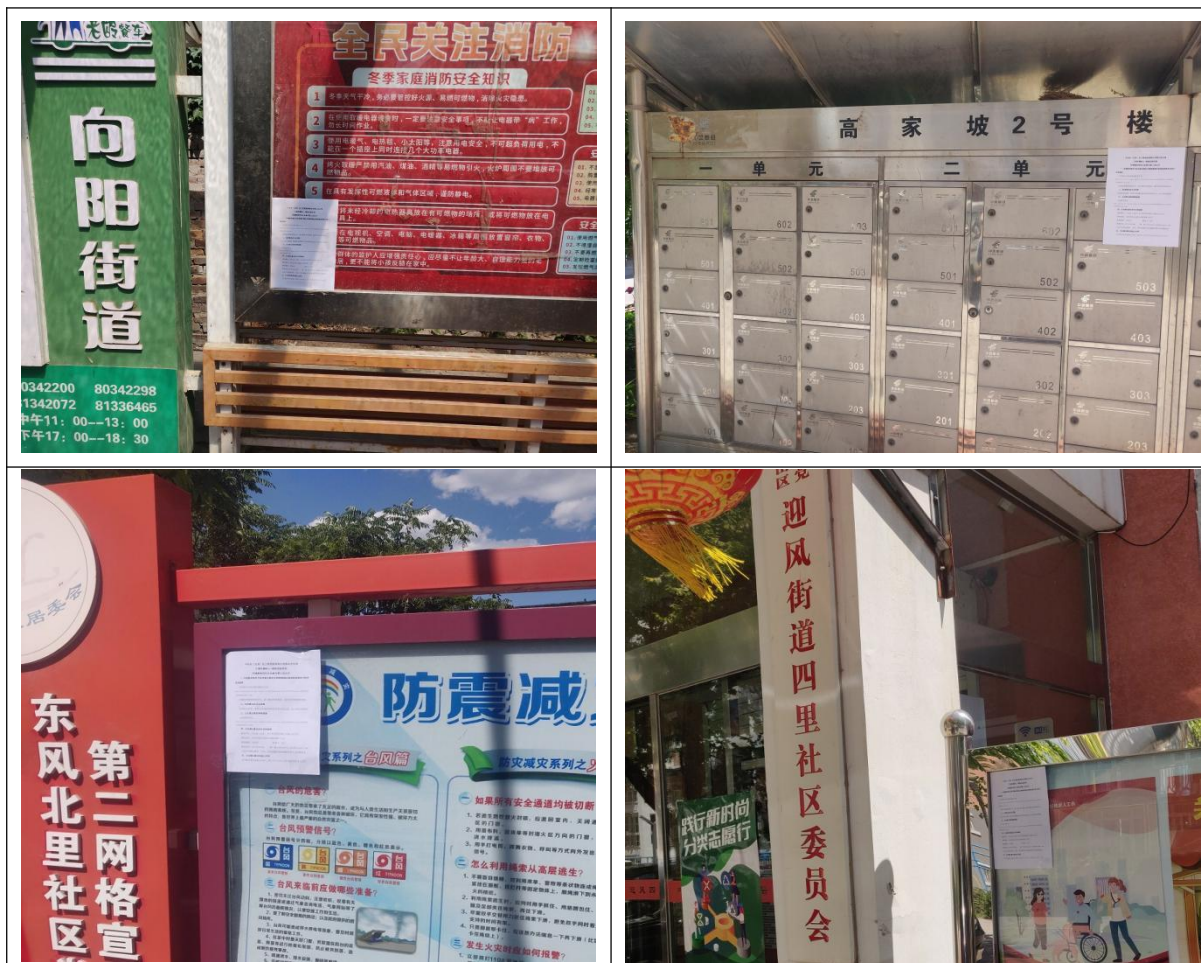
图 1.4- 4 征求意见稿全文公示张贴公告现场照片 (节选)

2024年5月31日,建设单位在本项目评价范围内各环境保护目标处张贴公示材料。部分照片如下。