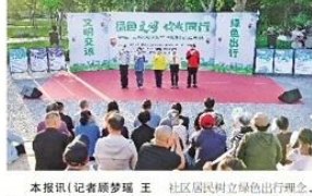
社区居民树立绿色出行理念,养成文明交通习惯,共同营造低碳、安全、文明、畅通的绿色交通环境。

此次活动旨在倡导绿色出行,提高市民的环保意识,共同营造文明、和谐、宜居的社区环境。