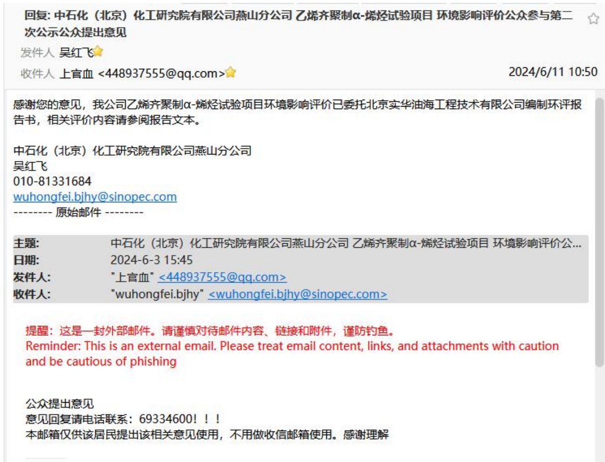
图 1.4- 6 公众意见回复