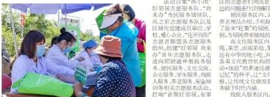
志愿者们为居民提供便民服务,切实以居民需求为导向,以居民参与为动力,让志愿服务“看得见、摸得着、接地气”。

活动现场,志愿者们热情地为居民提供便民服务,切实以居民需求为导向,以居民参与为动力,让志愿服务“看得见、摸得着、接地气”。