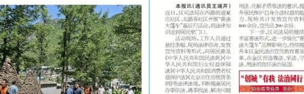
蒲洼乡东村举办第二届生态文化旅游日,展示当地生态文化旅游资源,带动乡村旅游发展。

本报讯(记者韩苗苗 通讯员刘越)近日,蒲洼乡东村举办以“京西山麓 凤鸣鹤鸣”为主题的第二届生态文化旅游日。活动旨在展示蒲洼乡生态文化旅游资源,带动乡村旅游发展,推动乡村振兴。