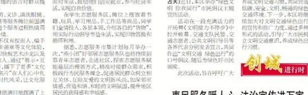
社区居民树立绿色出行理念,养成文明交通习惯,共同营造低碳、安全、文明、畅通的绿色交通环境。